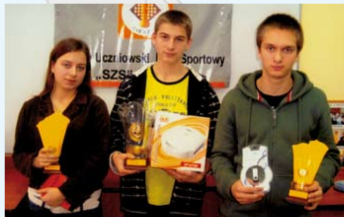
Grupa do 18 lat