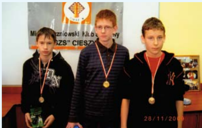
Grupa do 14 lat