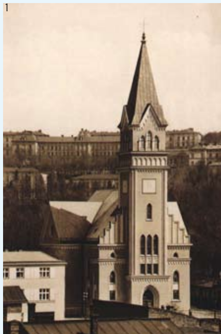
Kościół Na Niwach, 1940

Teskt pochodzi z ulotki pt. „Ślaziem pamiątek ewangelików cieszyńskich” wydanej przez Biuro Promocji i Informacji UM. Można ją bezpłatnie otrzymać w Cieszyńskim Centrum Informacji (Ratusz, parter).