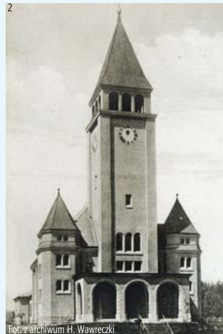
Kościół Czeskobraterski, 1931