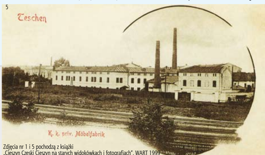
Zdjęcia nr 1 i 5 pochodzą z książki „Cieszyn Czeski Cieszyn na starych widokówkach i fotografiach”, WART 1999