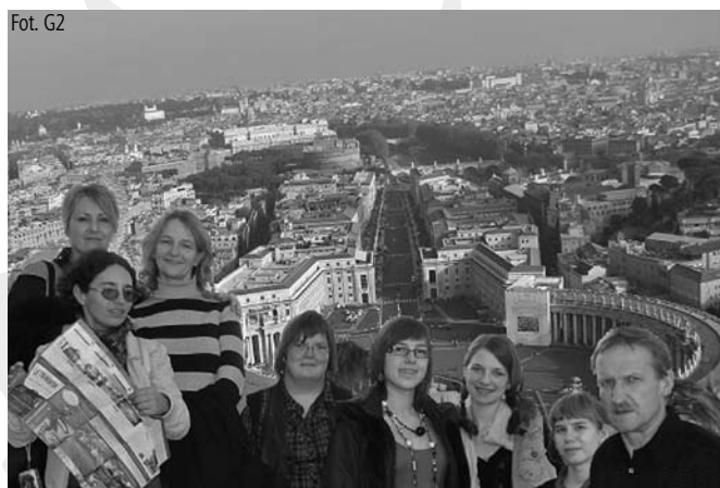
Przedstawiciele Gimnazjum nr 2, którzy odwiedzili Rzym

Z wyjazdu przywoziłam mnóstwo pięknych wrażeń i doświadczeń. Korzystając z okazji chcę podziękować wszystkim tym, którzy przyczynili się do zorganizowania tak udanego wyjazdu.