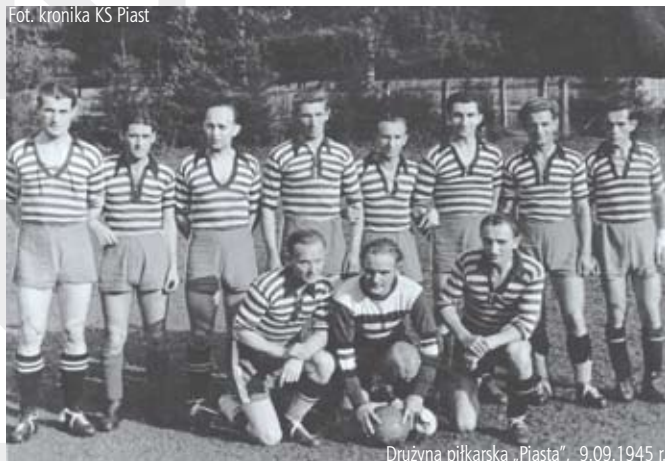
Drużyna piłkarska „Piasta”, 9.09.1945 r.